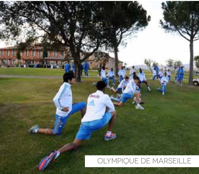
OLYMPIQUE DE MARSEILLE