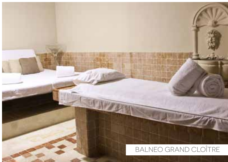
BALNEO GRAND CLOÎTRE