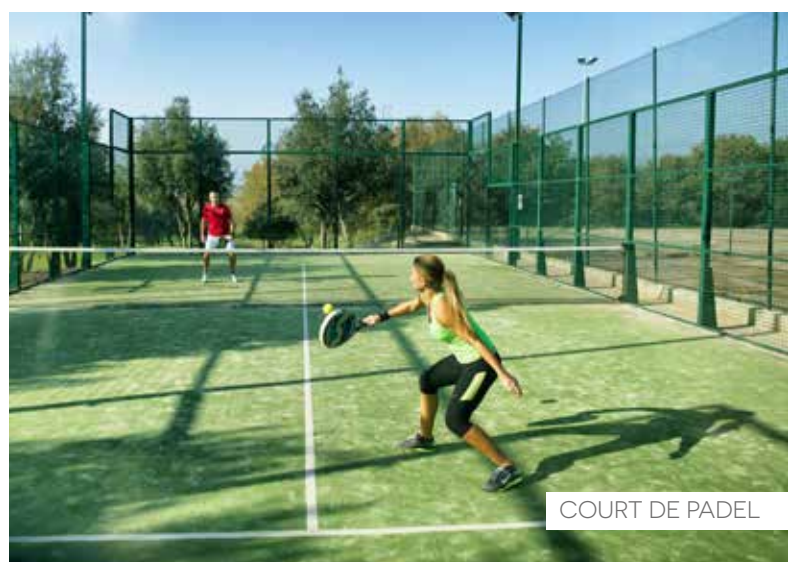
COURT DE PADEL