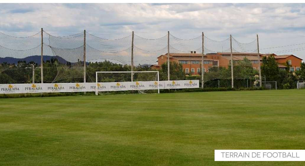
TERRAIN DE FOOTBALL