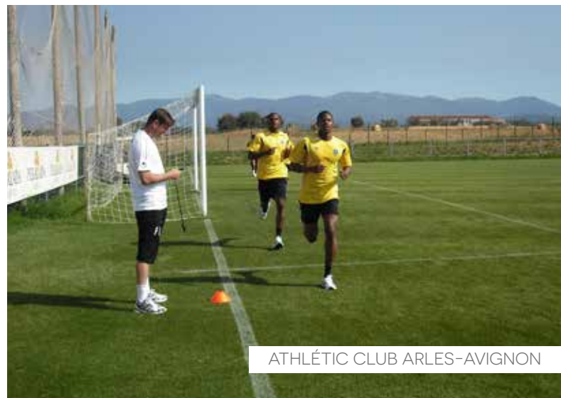
ATHLÉTIC CLUB ARLES-AVIGNON