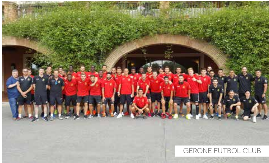
GÉRONE FUTBOL CLUB