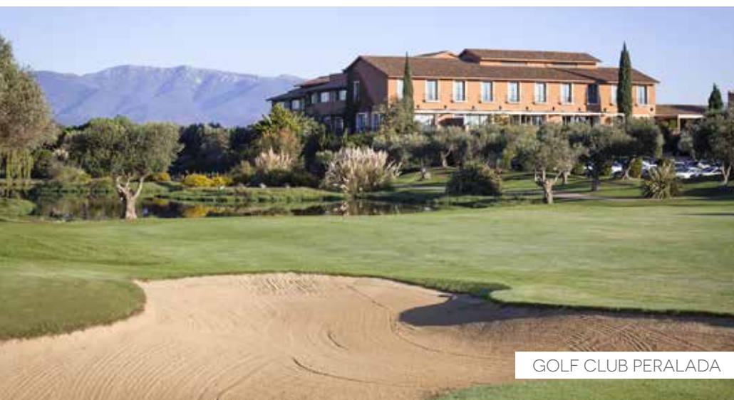
GOLF CLUB PERALADA