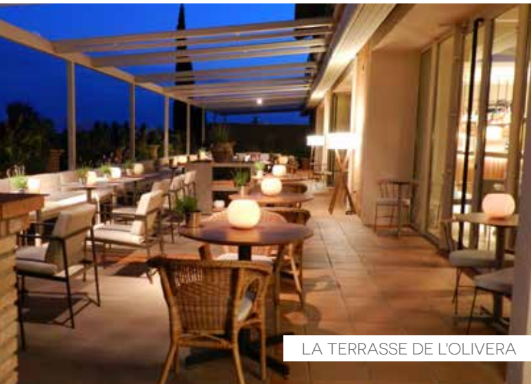
LA TERRASSE DE L'OLIVERA